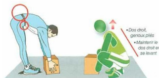
Décoller une charge