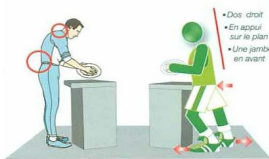
Devant un plan de travail